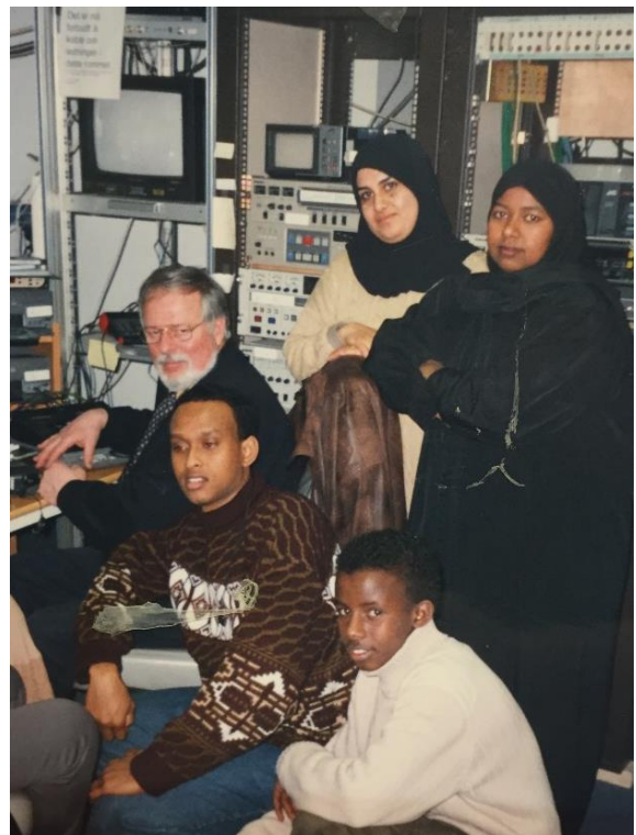
Skolen i Motzfeldtsgat, medieundervisning