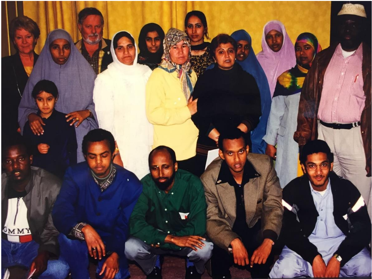
Klassebilde med elever og lærere første året på Deichmanske bibliotek, Grünerløkka