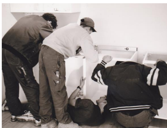
Skolen hadde håndverkslinje