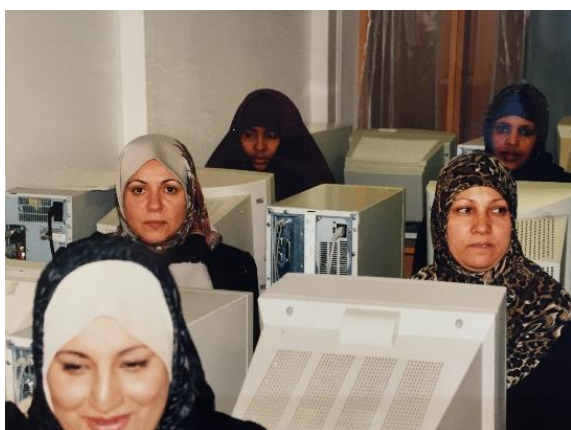
Data er viktig og morsomt