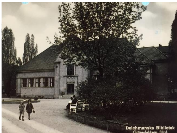
Deichmanske bibliotek, Grunerløkka

UrteHagen Videregående Privatskole – da med navnet UrteHagen Videregående Friskole – ble godkjent av Utdanningsdirektoratet som videregående skole etter kapittel 6A i friskoleloven i brev av 29. juli 2004. Skolen startet opp i leide lokaler i 2. etasje av Deichmanske bibliotek på Grunerløkka.