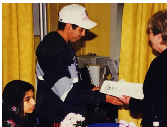
En blid elev som mottar bevis etter studieåret